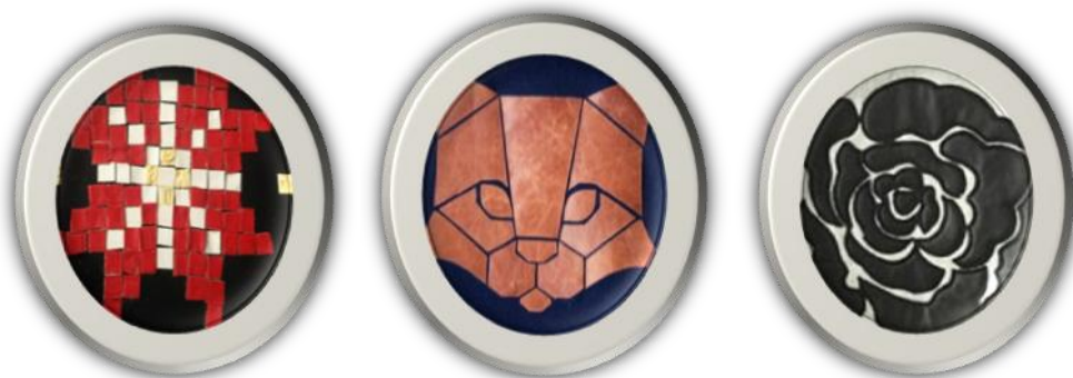
Сурет 1 – Былғарыдан орындалған кейбір жапсырмалар түрі

былғарыны қарастыруға болады. Тері өнімдерін қолданудағы қалдықтарды іске жаратуға бір жолы, ол жапсырмаларды жасап киімдердің айрықшылықтарын айқындау болады. Былғарыдан жапсырмаларды орындауда түрлі материалдармен (желім, жіппен біріктіру, бояулар т.б.) арнайы құрал саймандар қолданылады. Былғарыдан бедерлі бейнелерды белгілі температураға дейін қыздырылған құралдармен өңдеу арқылы алуға болады. Жапсырманы престоу арқылы оны берілген пішімде қиып, оның бетінде көлемді бейнені жасауға болады, бұл жағдайда арнайы жасалған, қыздырылатын пуансон-штампарды қолданады (көбінесе шығарылатын өнімнің саны көп болғанда). Бедерлі-көлемді жапсырмаларды орындауда қыздырылған құралмен сурет салу арқылы, көп қабаттарды беттестіріп жапсыру кең таралған. Сурет 1 де кейбір жапсырмалардың үлгілерін жасап келтірдік.