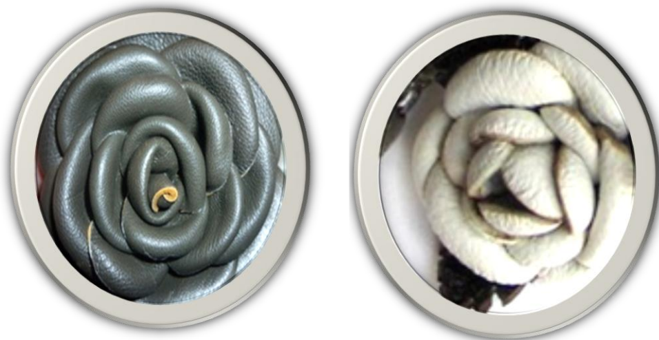
Сурет 4 – Былғарыдан орындалған раушан гүлі түріндегі әшекейдің боялмаған дайындамалары

Осы тәсілді қолданып орындалған, былғарыдан жасалған раушан гүлінің үлгілері сурет 4 келтірілген.